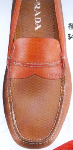
橙啡色loafer $4,200 Prada