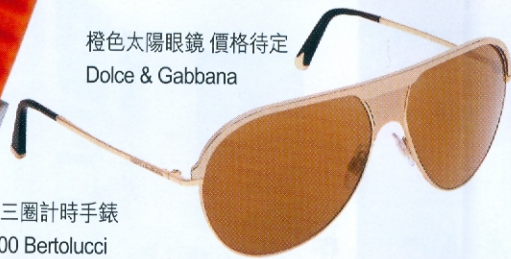
橙色太陽眼鏡 價格待定 Dolce & Gabbana