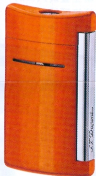
橙色打火機 $1,100 S.T. Dupont