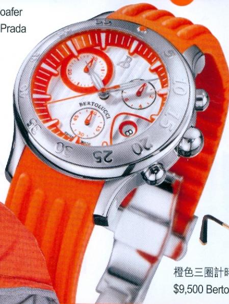
橙色三圈計時手錶 $9,500 Bertolucci