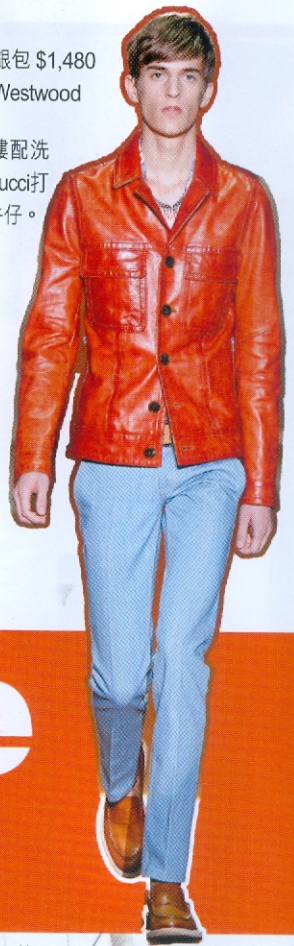
橙色皮褸配洗 水牛，Gucci打 造另類牛仔。