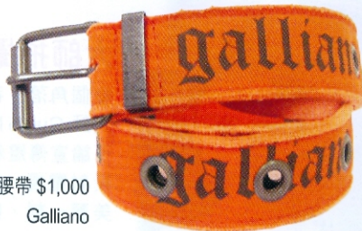
橙色腰帶 $1,000 Galliano