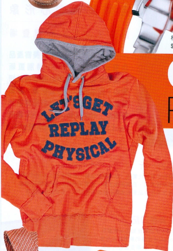
橙色衛衣 價格待定 Replay