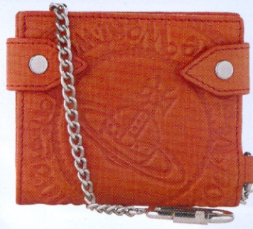
橙色皮革銀包 $1,480 Vivienne Westwood