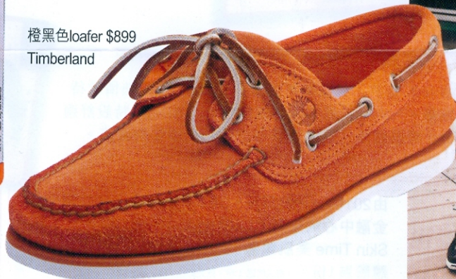
橙黑色loafer $899 Timberland